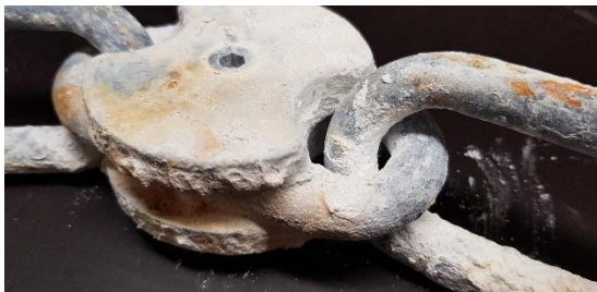
16mm kettinki sinkillä