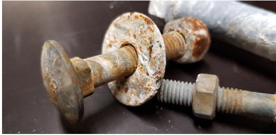
Uimaportaan askelmien pultit