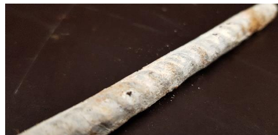
Harjateräs 12mm, toinen pää maalattu Wurthin sinkkisprayllä