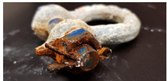
Sakkeli Haklift malli