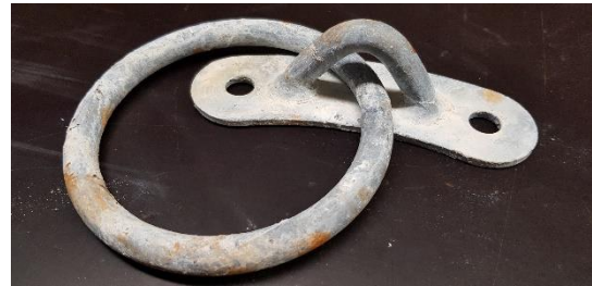
Venerengas 12mm KZN