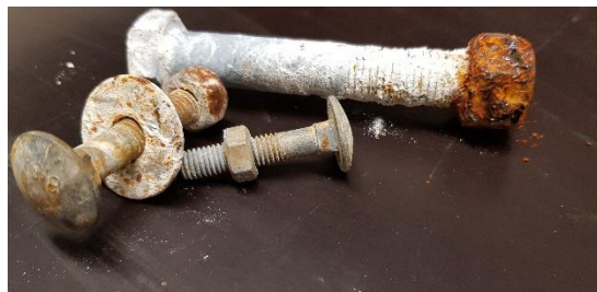
16mm KZN pultti ja sähkösinkitty mutteri